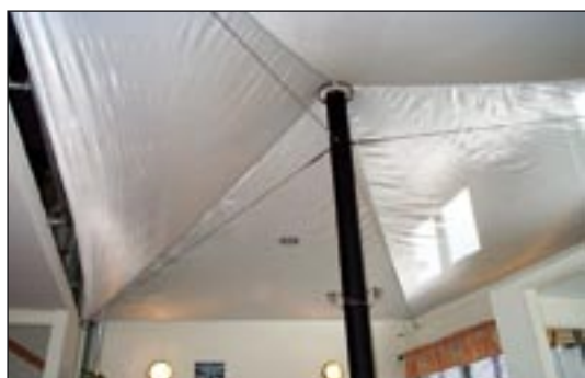
Erco Systems AB, Uddevalla